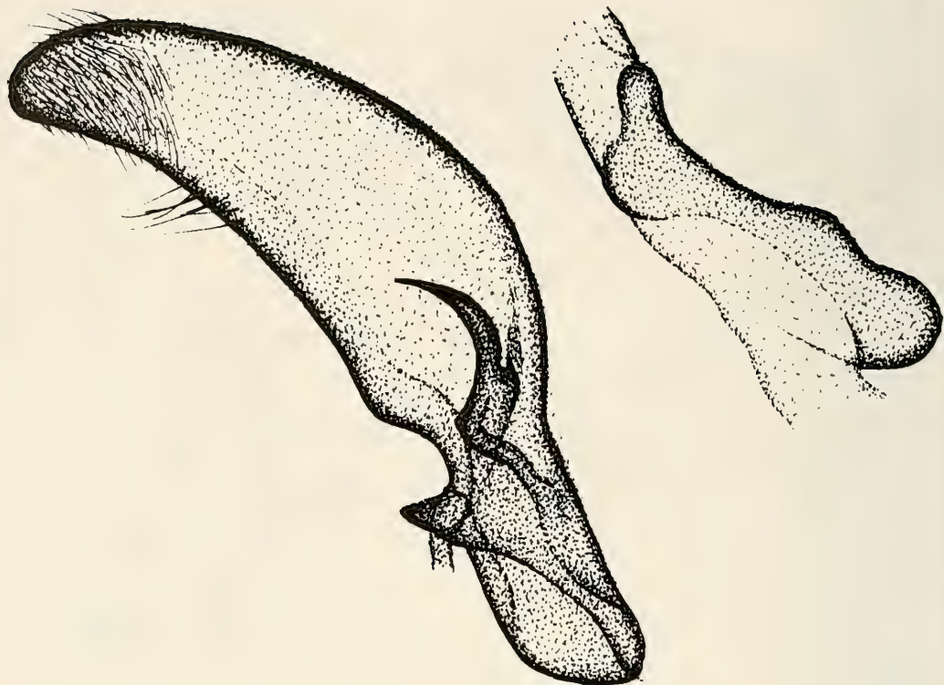
Abb. 3. Borbotana nivifascia Walker, ♂ Genital.